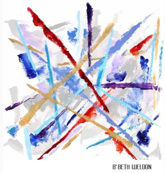
B' BETH WELDON