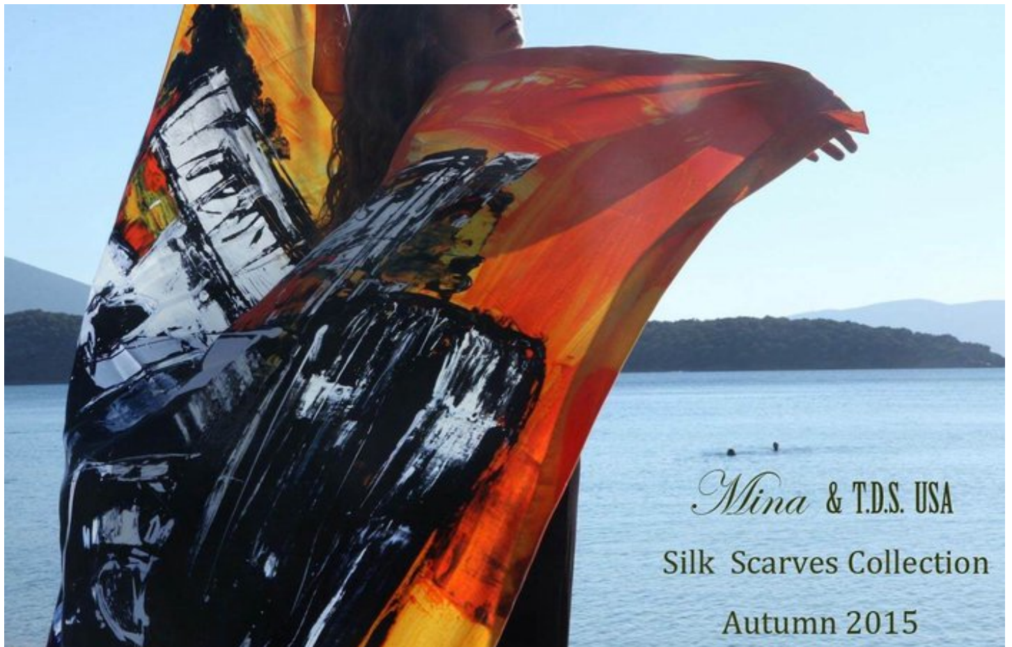
Μίνα Παπαθεοδώρου Βαλυράκη έργο τέχνης Μίνα Παπαθεοδώρου Βαλυράκη Silk Scarves - Pochets TDS+MINA P.V. USA