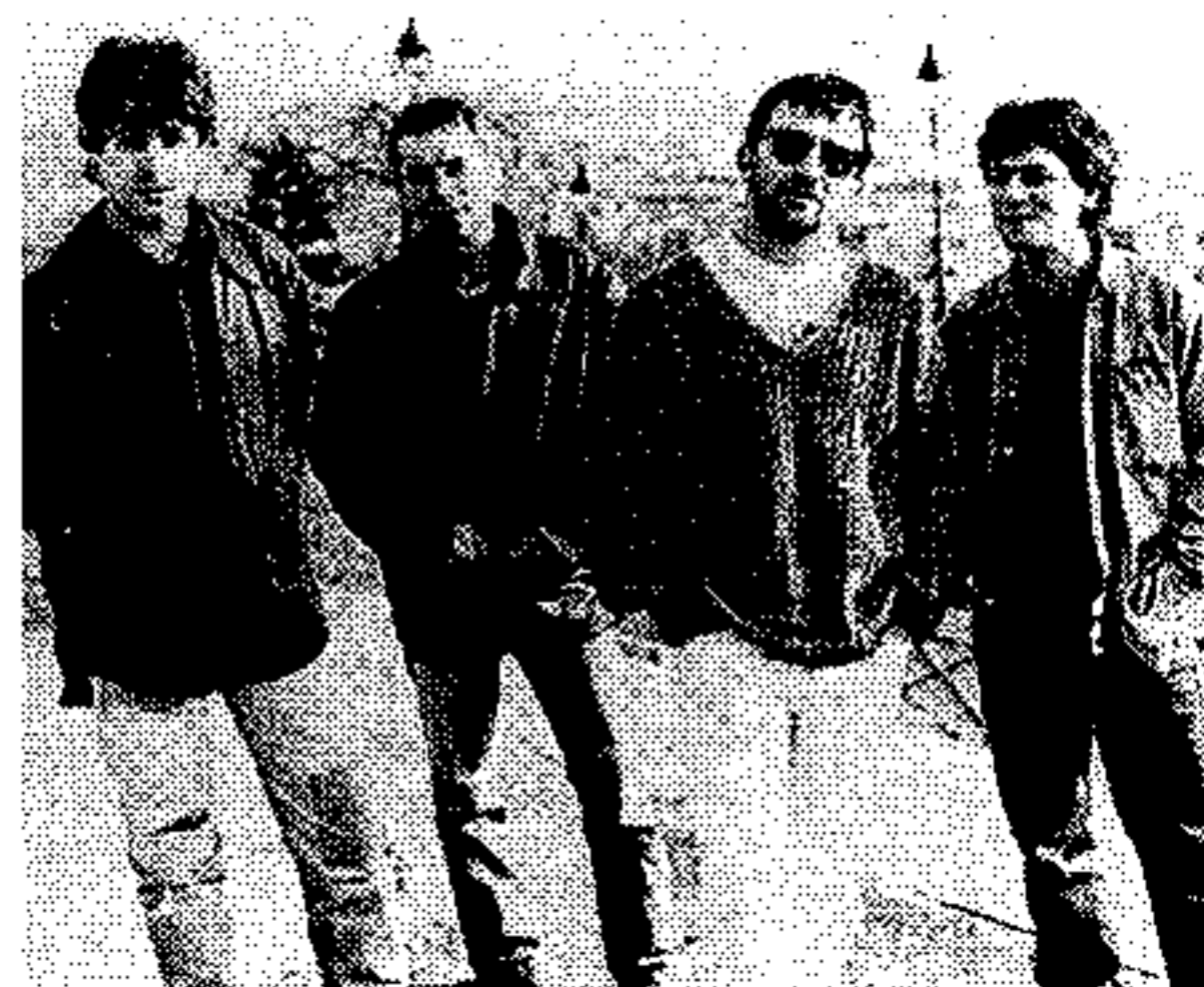
Οι Lightning Seeds στη Θεσσαλονίκη

Ο ανήσυχος και ειρηνικός Τέρι Χολ των πάλαι ποτέ Specials και του φρέσκου άλμπουμ «Home» μαζί με τους Lightning Seeds