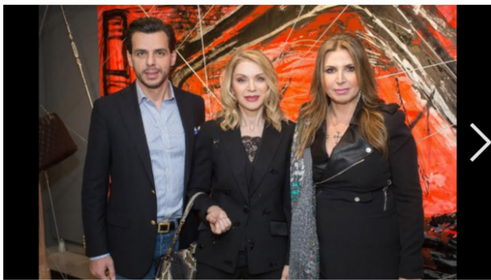
6 Photos: Έκθεση «Women Bridging World»

Χορηγός της έκθεσης ήταν το Bombay Sapphire της εταιρίας AMBYE που οργάνωσε με υψηλής αισθητικής διακόσμηση τον έξω χώρο, προσφέροντας στους καλεσμένους φιλότεχνους τη γεύση του γνωστού Gin Tonic ενθουσιάζοντας τους.